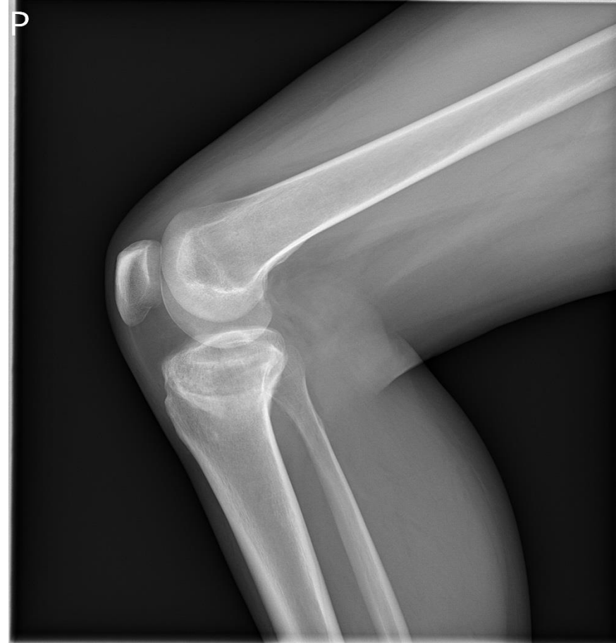
Avaskulární nekróza epikondylů stehenní a holení kosti oboustranně